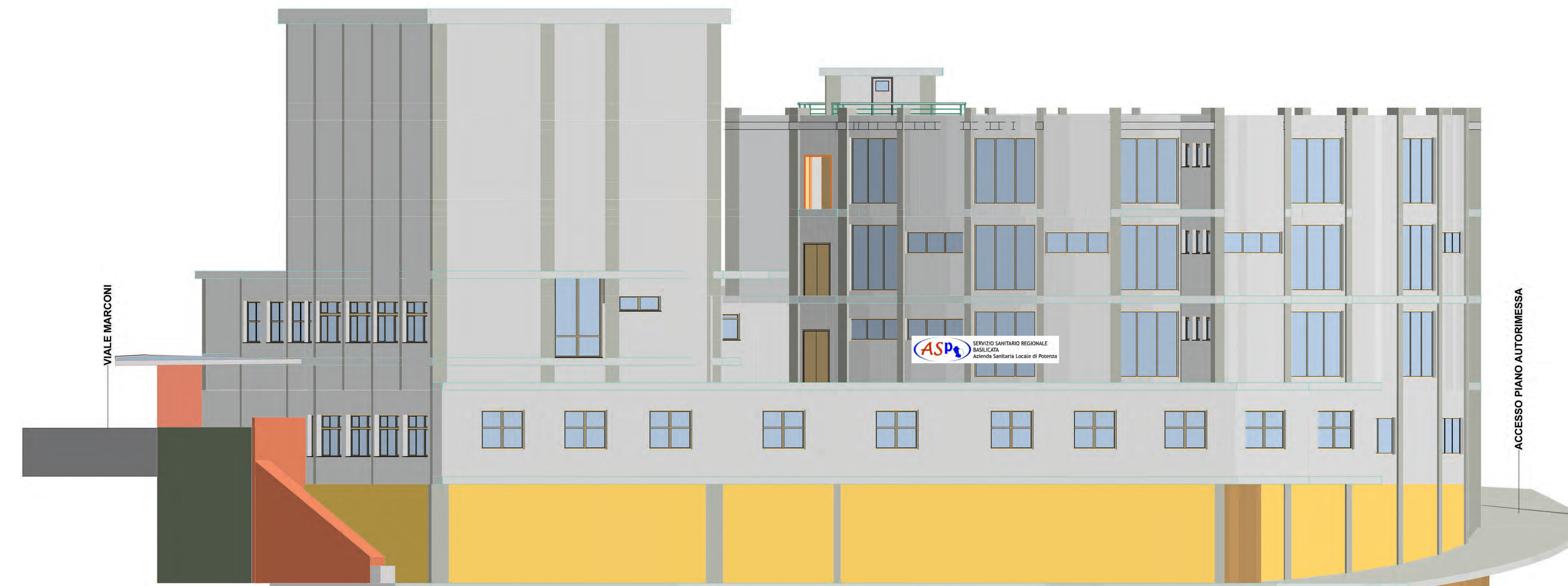
PROSPETTO LATO AUTORIMESSA